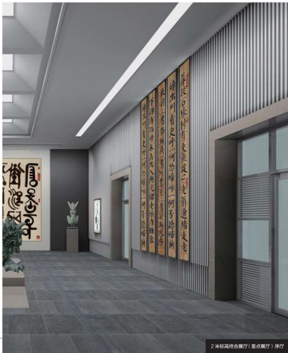
2米标高综合展厅(重点展厅)序厅