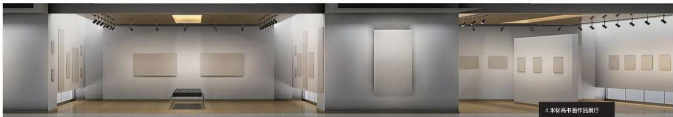
4米标高书画作品展厅